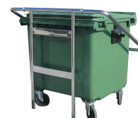
Contain Inox CSSI