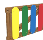
Colores Puerta JV01C-PT