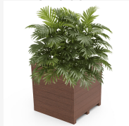
Madera polímero 100% reciclado UM1640-6PR