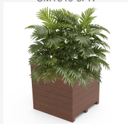
Madera polímero 100% reciclado UM1640-6PR