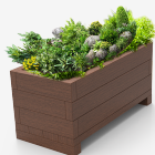
polímero 100% reciclado UM1640-2PR