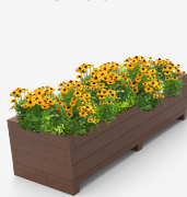
polímero 100% reciclado UM1640-1PR