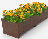
polímero 100% reciclado UM1640-1PR