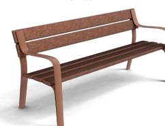
Citizen Eco UM301PR