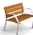
NeoBarcino ALU UM304SAL