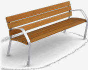
NeoBarcino ALU UM304AL