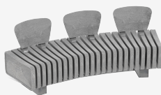
VERTEBRA CURVO R UM323R