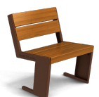
Quatro S UM377SM