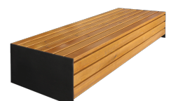
Arq B UM384B