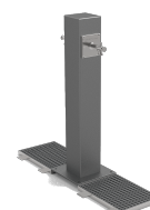
Atlas Doble UM511-2M