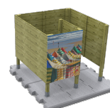
Surf MAD UM532