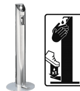
Dispensador de gel V1I