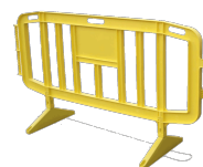
Bardal 200 VVP200A