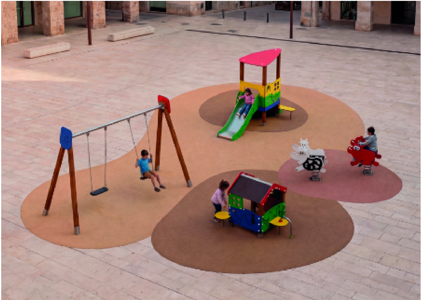
MADERA 1 plano 1 cuna JL1511000