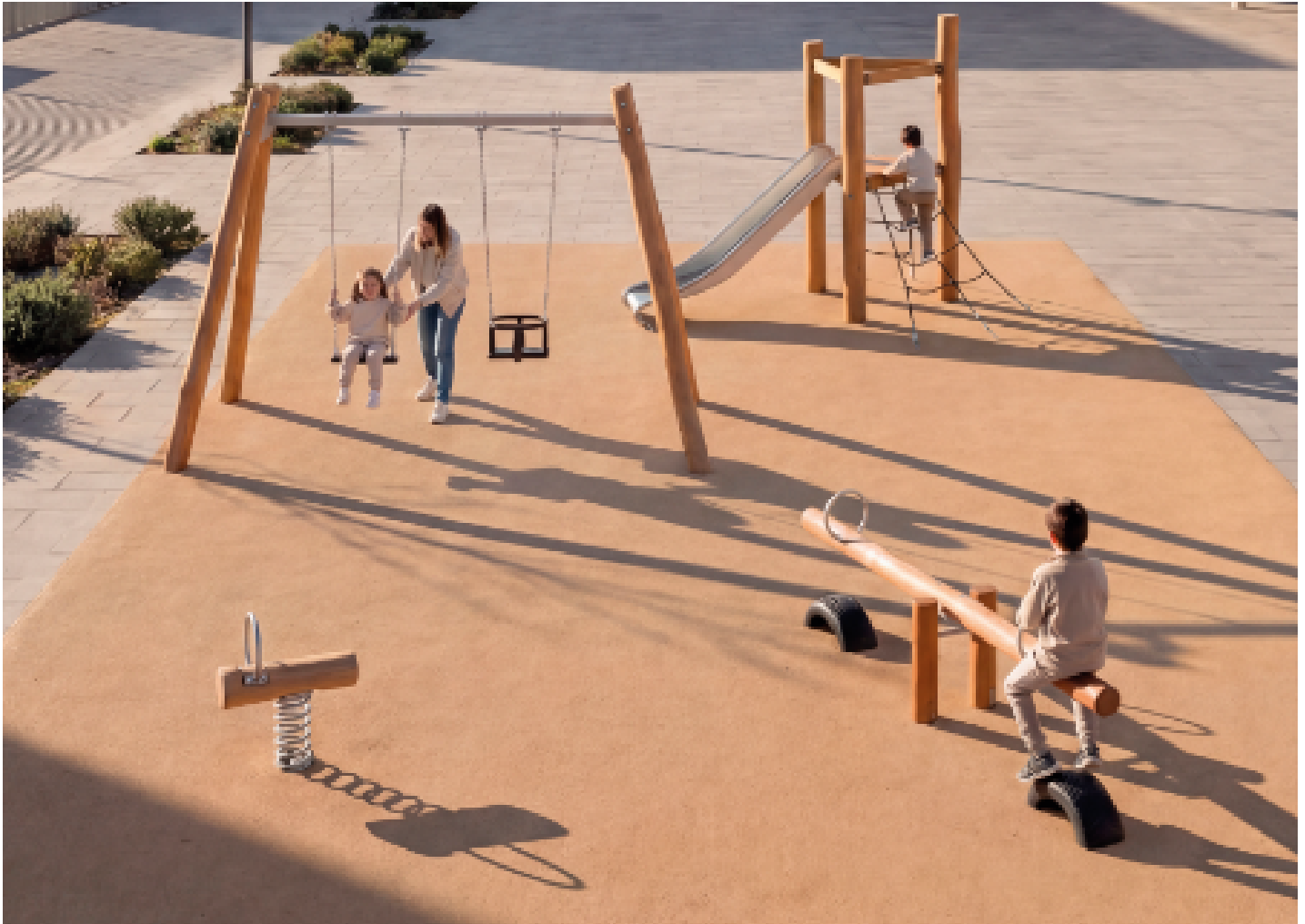
Iroy 1 JROYM01