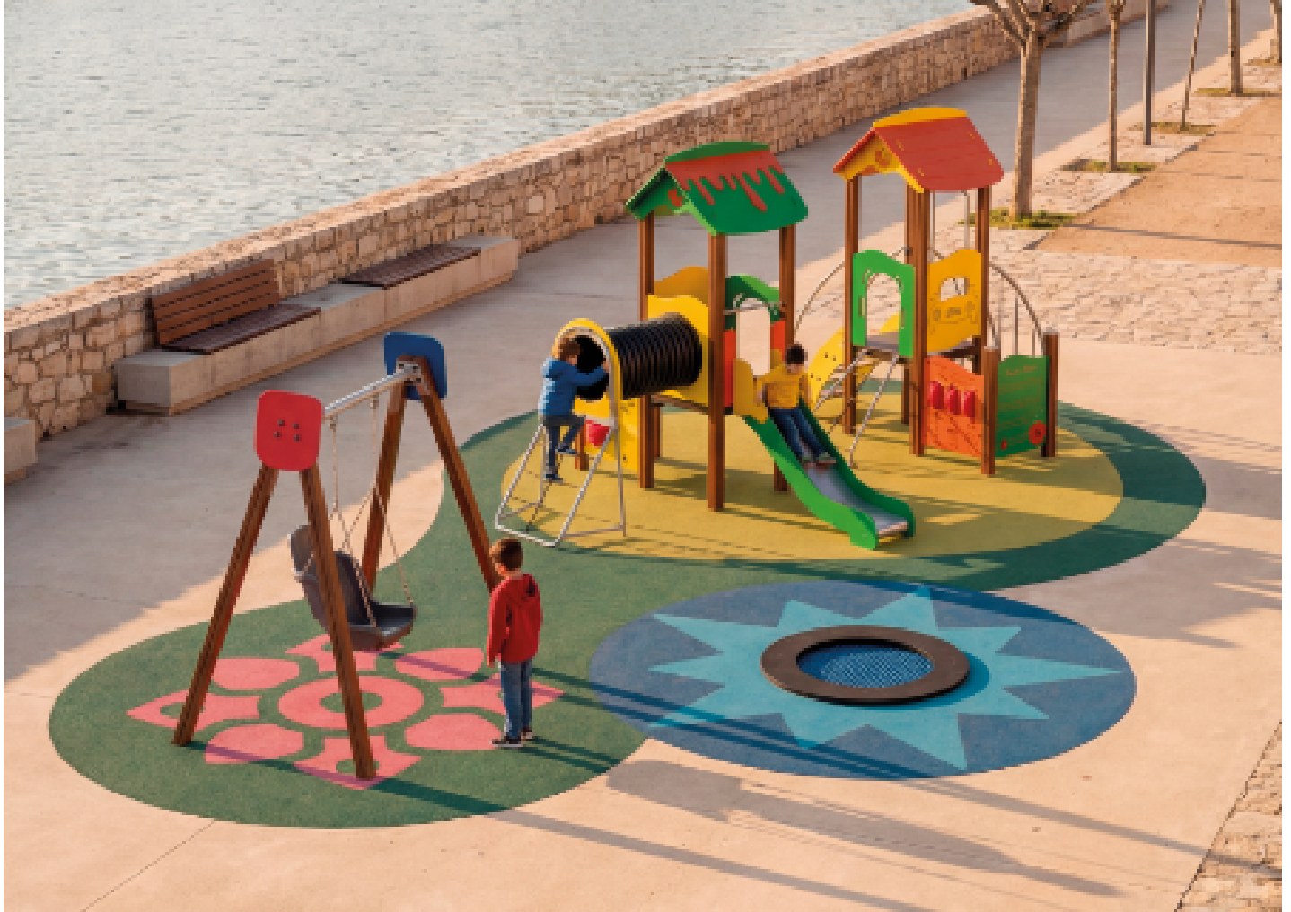
METAL 1 adaptado JL1000100