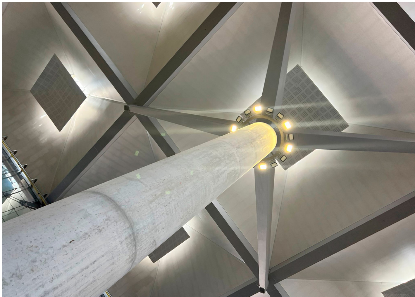
Milan XL APMXL

El Aeropuerto de Málaga-Costa del Sol, equipado con proyectores Milan, uno de nuestros proyectores con más amplio rango de potencias y distribuciones lumínicas, para adaptarse a cualquier proyecto.