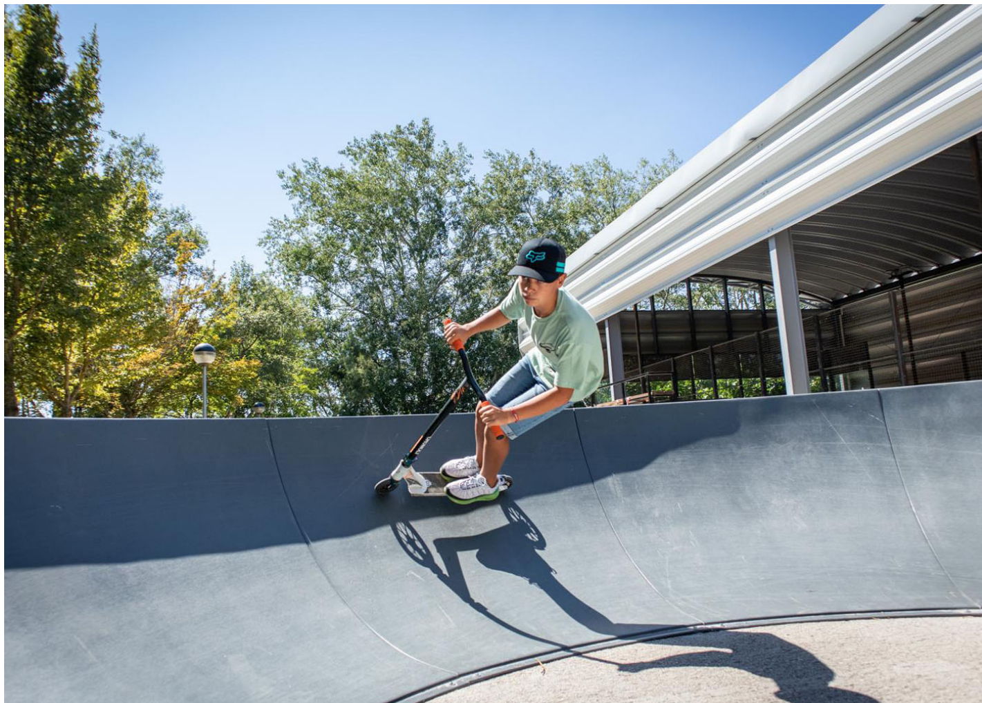
Pump Track 41mL JPT050

Instalación de un Pump Track de 41 m 2 en la provincia de Cuenca: un espacio seguro y diseñado para aprender y disfrutar en bicicleta y patinete.