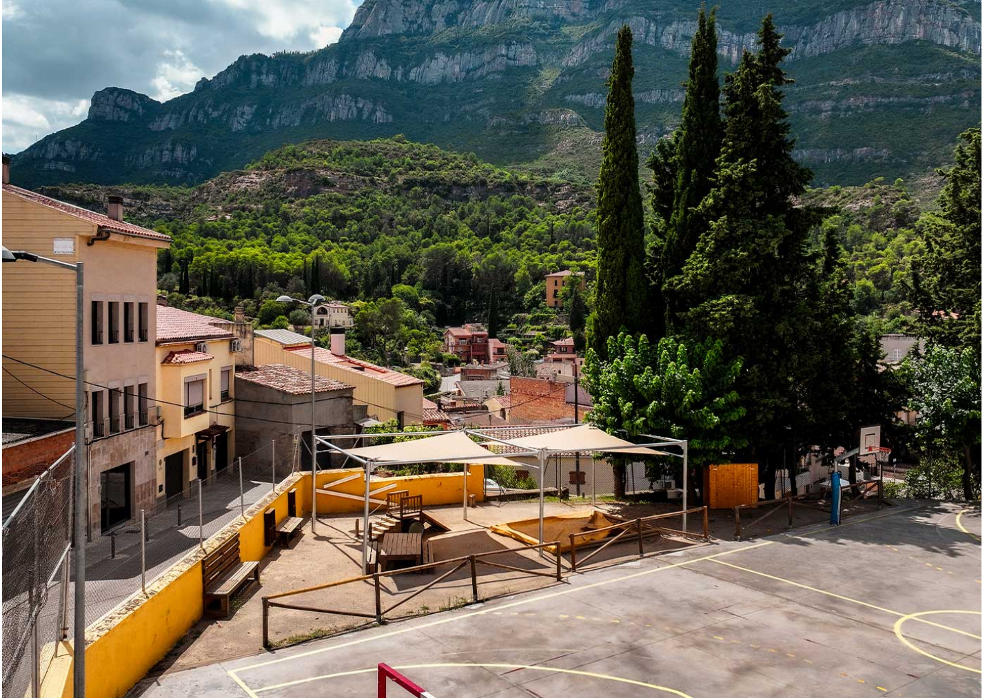
MÓDULO 5x5 JGV5X5

En la escuela infantil de Monistrol de Montserrat, Barcelona, se instalaron velas autoportantes que generan zonas de sombra en juegos y arenero del patio, protegiendo a los niños del sol.