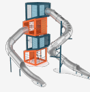
Cubo XL JTEM64