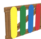
Colores Puerta JV01C-PT