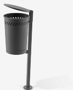
MUS tapa PA624T