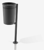
MUS - SUELO BLANDO PA624SB