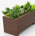
polímero 100% reciclado UM1640-2PR