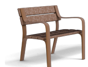
Citizen Eco UM301SPR