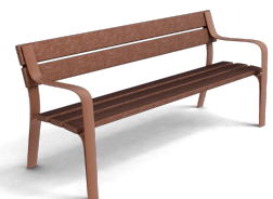
Citizen Eco UM301PR