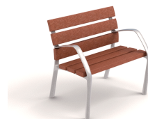
NeoBarcino ReBnew UM304NSPRH