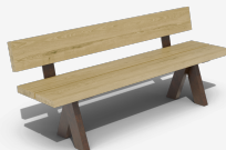
Olea ReBnew UM314BPR