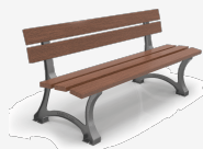
Recycled Polymers UM374PRH