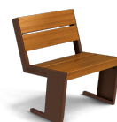
Quatro S UM377SM