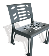
Silla Essen UM379S