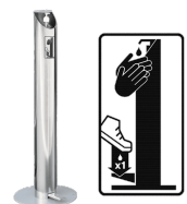
Dispensador de gel V11