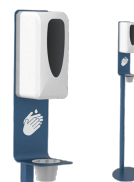
Dispensador de gel AUTOMATICO V3P