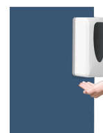
Dispensador de gel V3