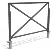
ST. ANDRÉ AMOVIBLE VVBA84M-1