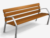
Neobarcino 1800 UM304M1800