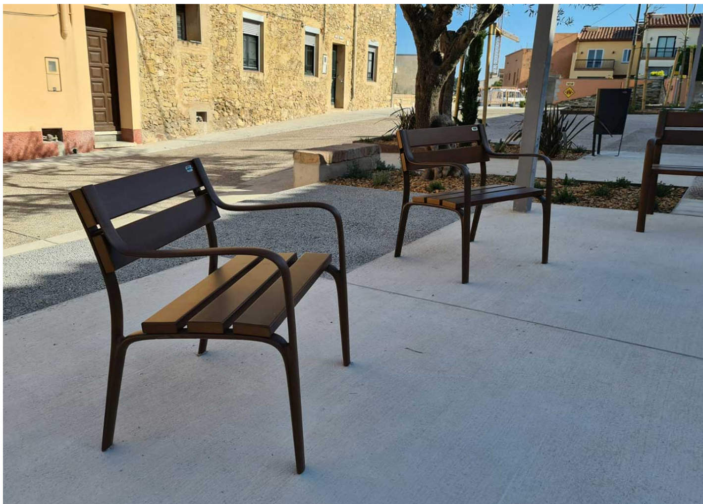
Argo 80 PA613

Instalación de bancos y sillas Citizen de madera y fundición en el municipio de Llers en la provincia de Gerona.