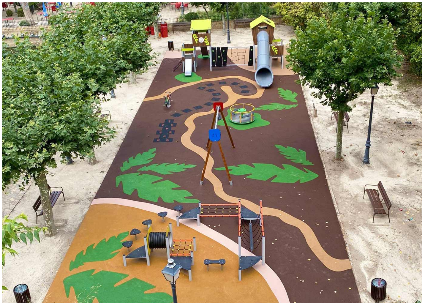
Bosco 4 JPVB04

BENITO ha hecho posible que la presa de Muel cuente con un nuevo espacio urbano donde los niños puedan aprender la historia de su municipio con total seguridad y diversión.