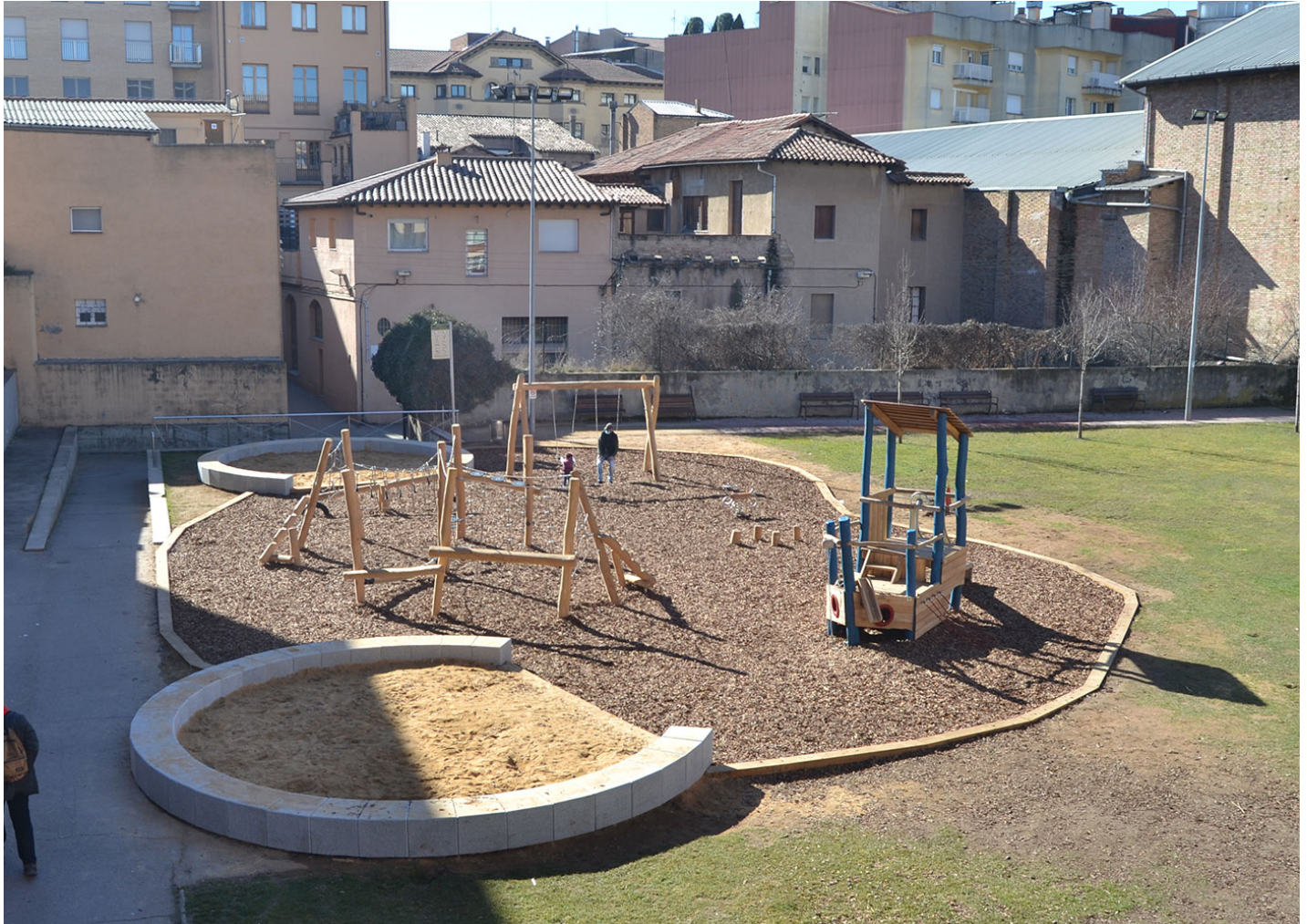
Kube Kurve UM372SK

El parque Bassa dels Hermanos en Vic instala juegos de madera de robinia. Un conjunto de juegos que combinan modernidad, tradición y una de las maderas más resistentes.