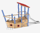
Roybo 2 planos JROYC20000