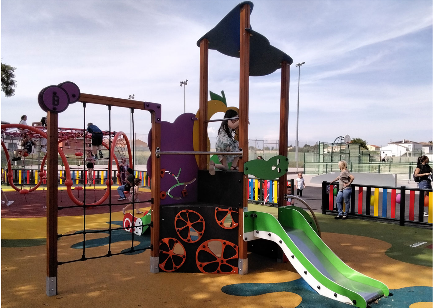
METALICA DE COLORES VVP034

Abierto el nuevo parque infantil de Pinet, cumpliendo así con una de las peticiones vecinales más generalizadas de la zona.