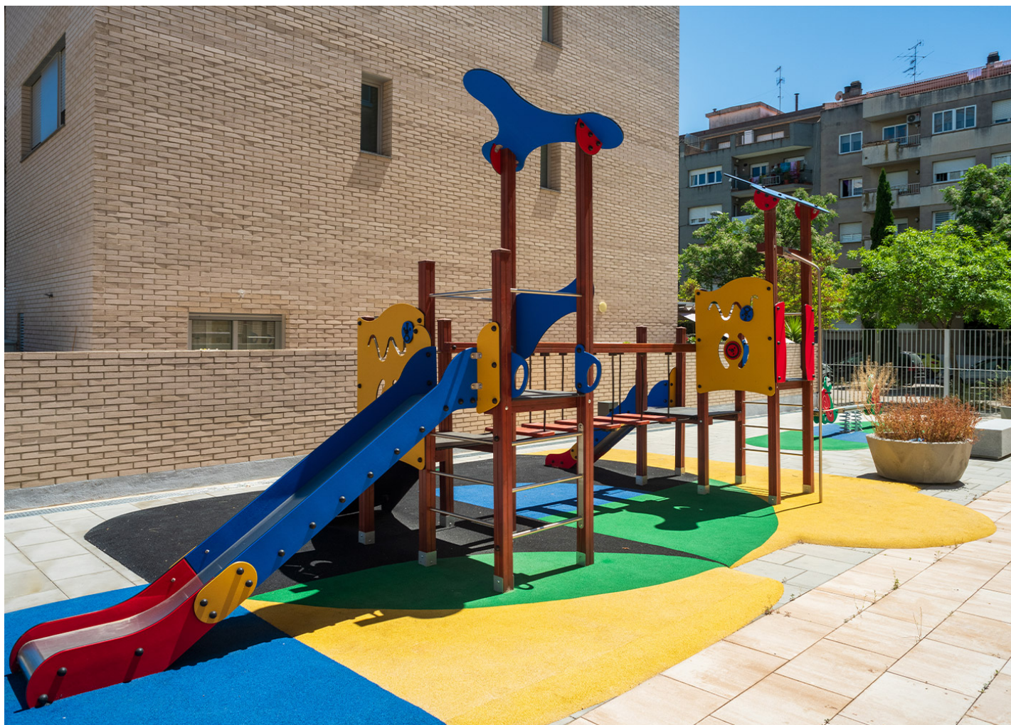
MADERA 1 nido JL1500010

En una zona residencial de Vilafranca del Penedès (Barcelona) se ha creado un área de juego completamente nueva con elementos infantiles y mobiliario urbano.