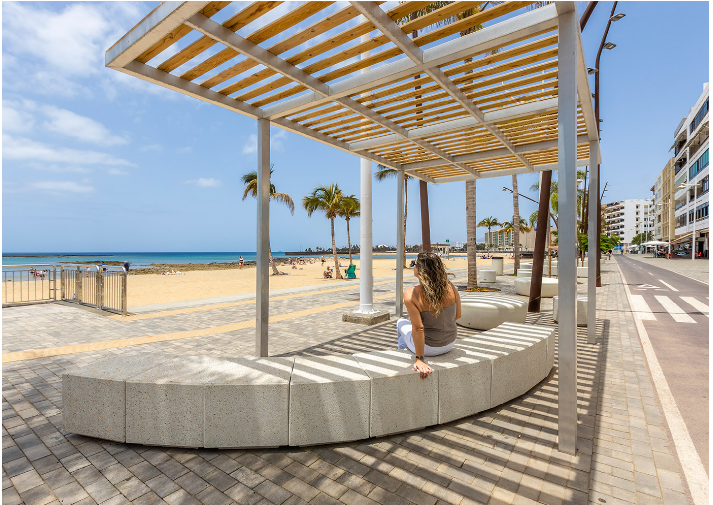
Kube Kurve UM372SK

Renovación en Arrecife (Lanzarote), ahora peatonal, con mobiliario urbano de hormigón blanco resistente al clima: bancos Kube Kurve, sillas Lisa y Ficus, banco Volga y luminarias Milan.