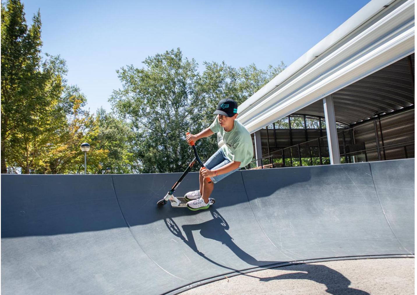
Pump Track 41mL JPT050

Instalación de un Pump Track de 41 m 2 en la provincia de Cuenca: un espacio seguro y diseñado para aprender y disfrutar en bicicleta y patinete.