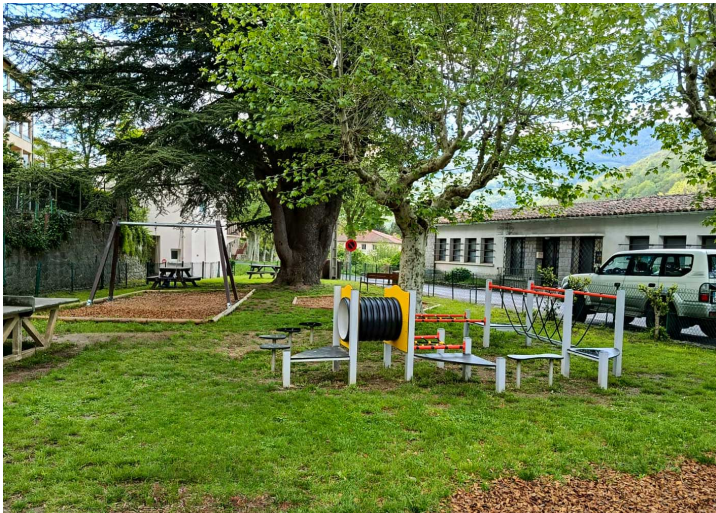
Loop 4 JPV413

En la comuna francesa de Prats-de-Mollo-la-Preste se han instalado elementos de la gama Play, como la valla metálica de colores, el juego modular de la línea PINT, un trampolín y más.